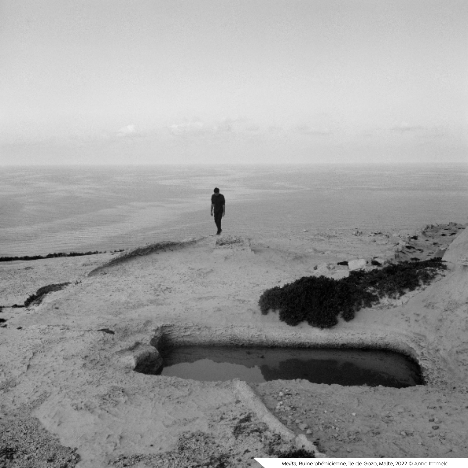
Melita , Ruine phénicienne, île de Gozo, Malte, 2022