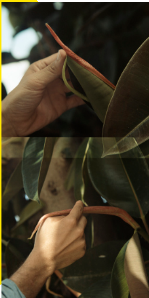
Melita, Ficus, Malte, 2023

CLIQUEZ SUR UNE IMAGE POUR DÉCOUVRIR PLUS EN DÉTAILS L'EXPOSITION.