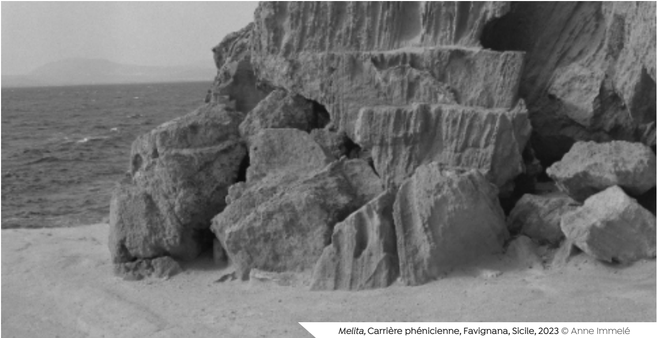
Melita, Carrière phénicienne, Favignana, Sicile, 2023