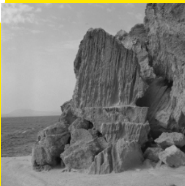
Melita, Carrière phénicienne, Favignana, Sicile, 2023