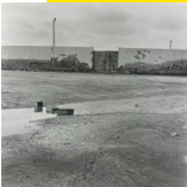
Melita, Port de Zarzis, Tunisie, 2023