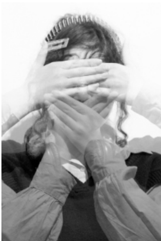
Exemples de portraits et séquences