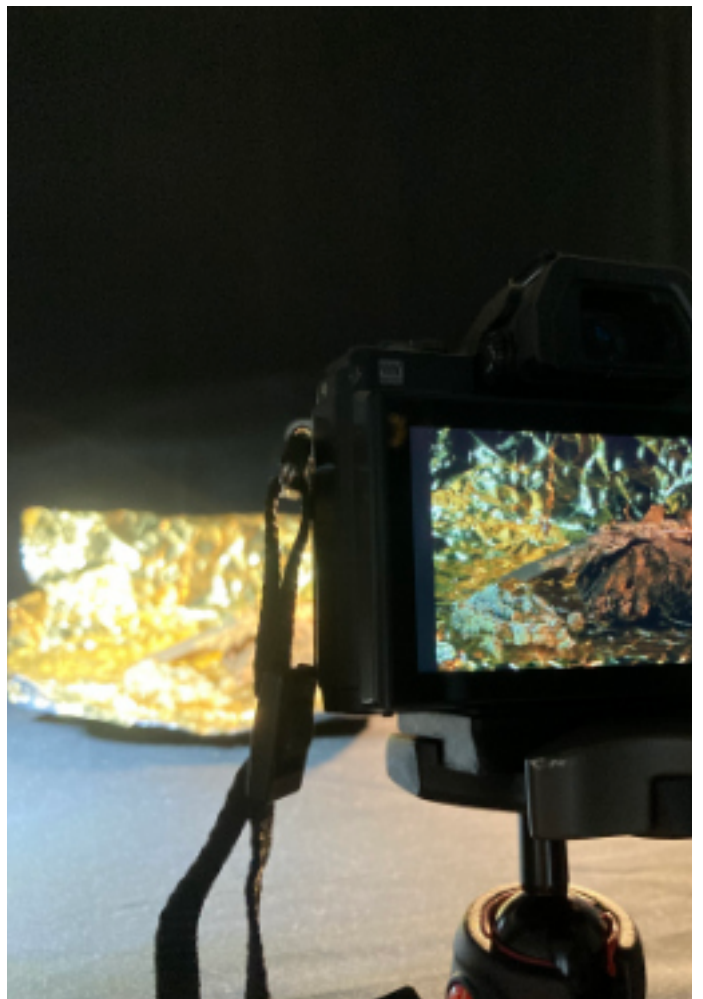
Exemples de cabanes