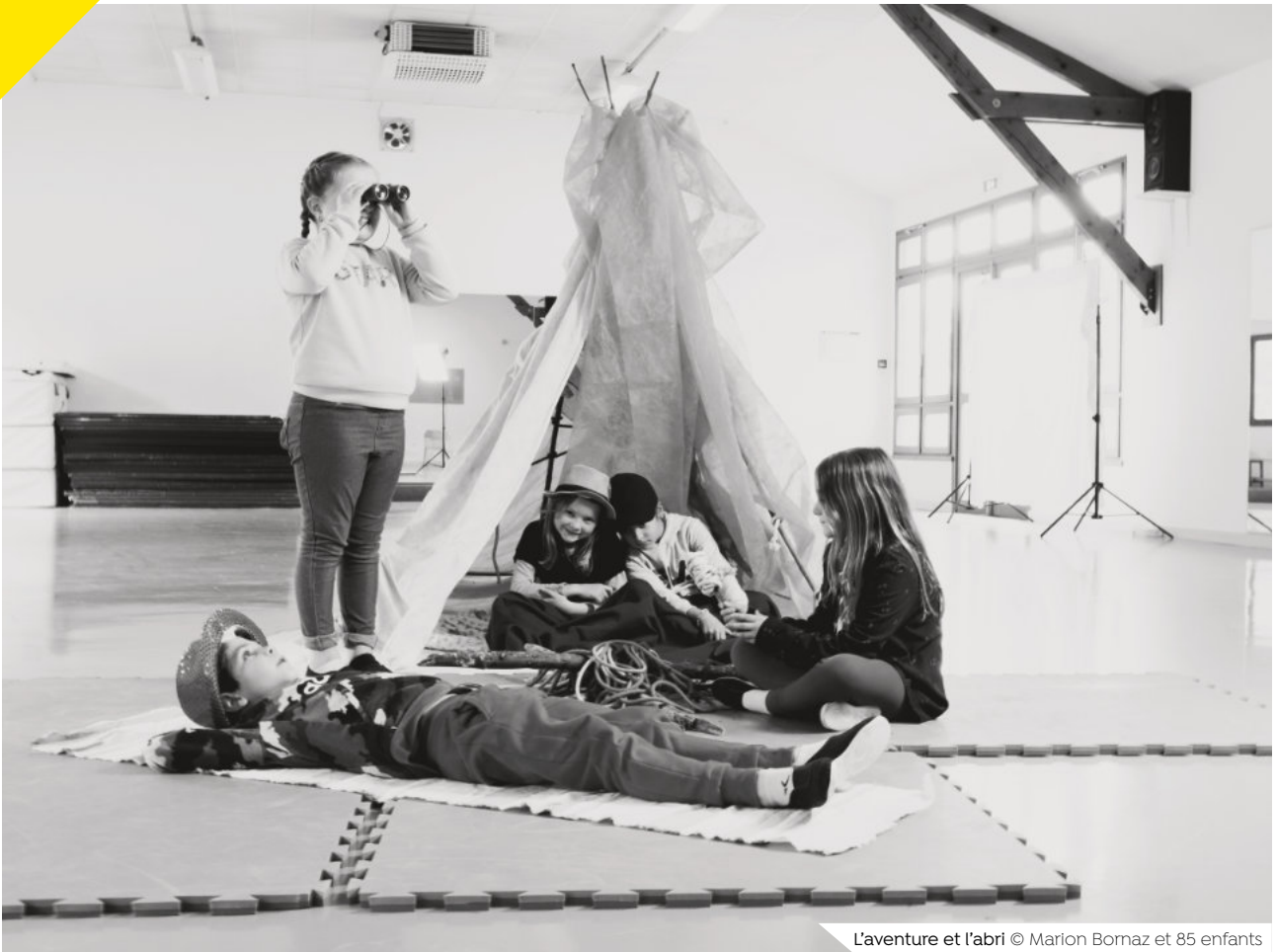
L'aventure et l'abri © Marion Bornaz et 85 enfants