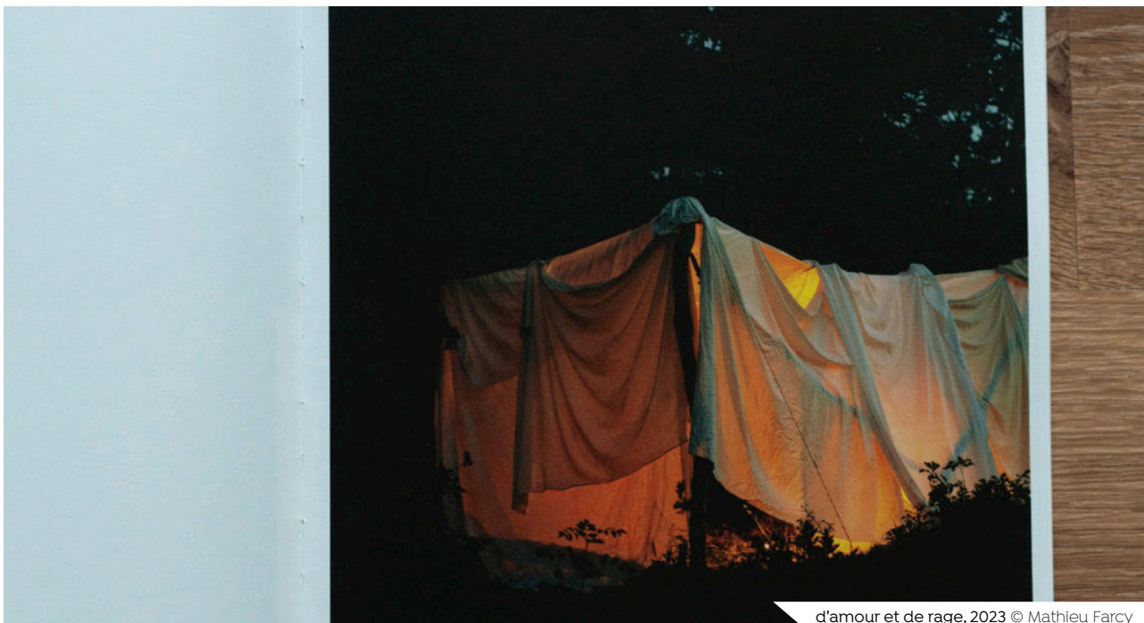
d'amour et de rage, 2023 © Mathieu Farcy

Œuvre créée dans le cadre de la résidence de création 5 étoiles portée par Stimultania