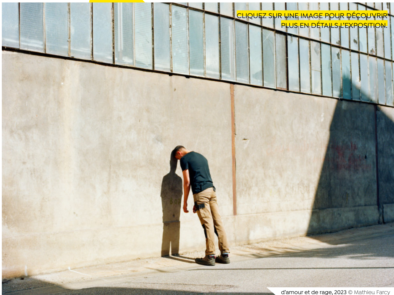
d'amour et de rage, 2023 © Mathieu Farcy

CLIQUEZ SUR UNE IMAGE POUR DÉCOUVRIR PLUS EN DÉTAILS L'EXPOSITION.