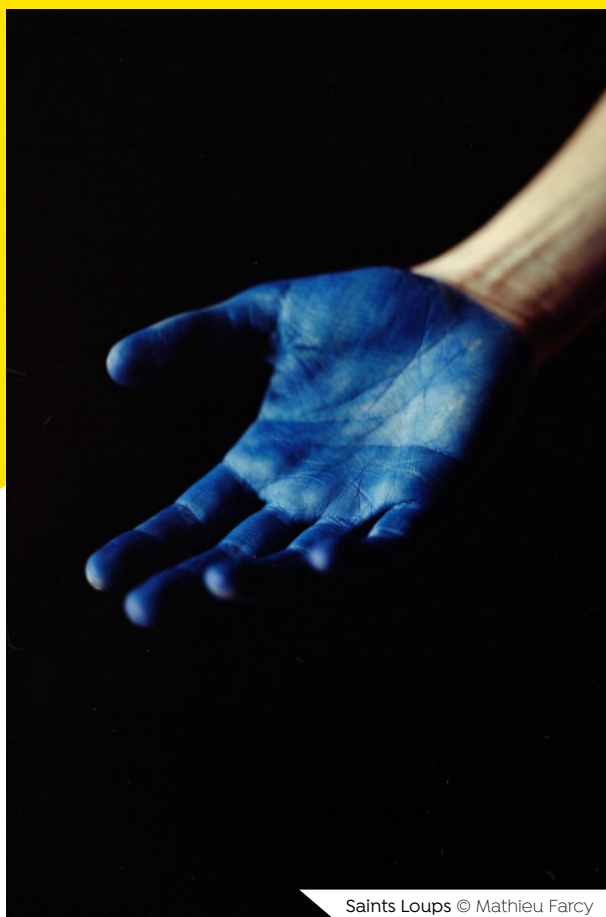
Saints Loups