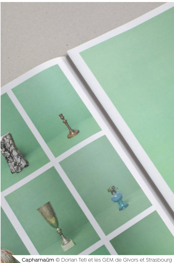
Capharnaüm © Dorian Teti et les GEM de Givors et Strasbourg