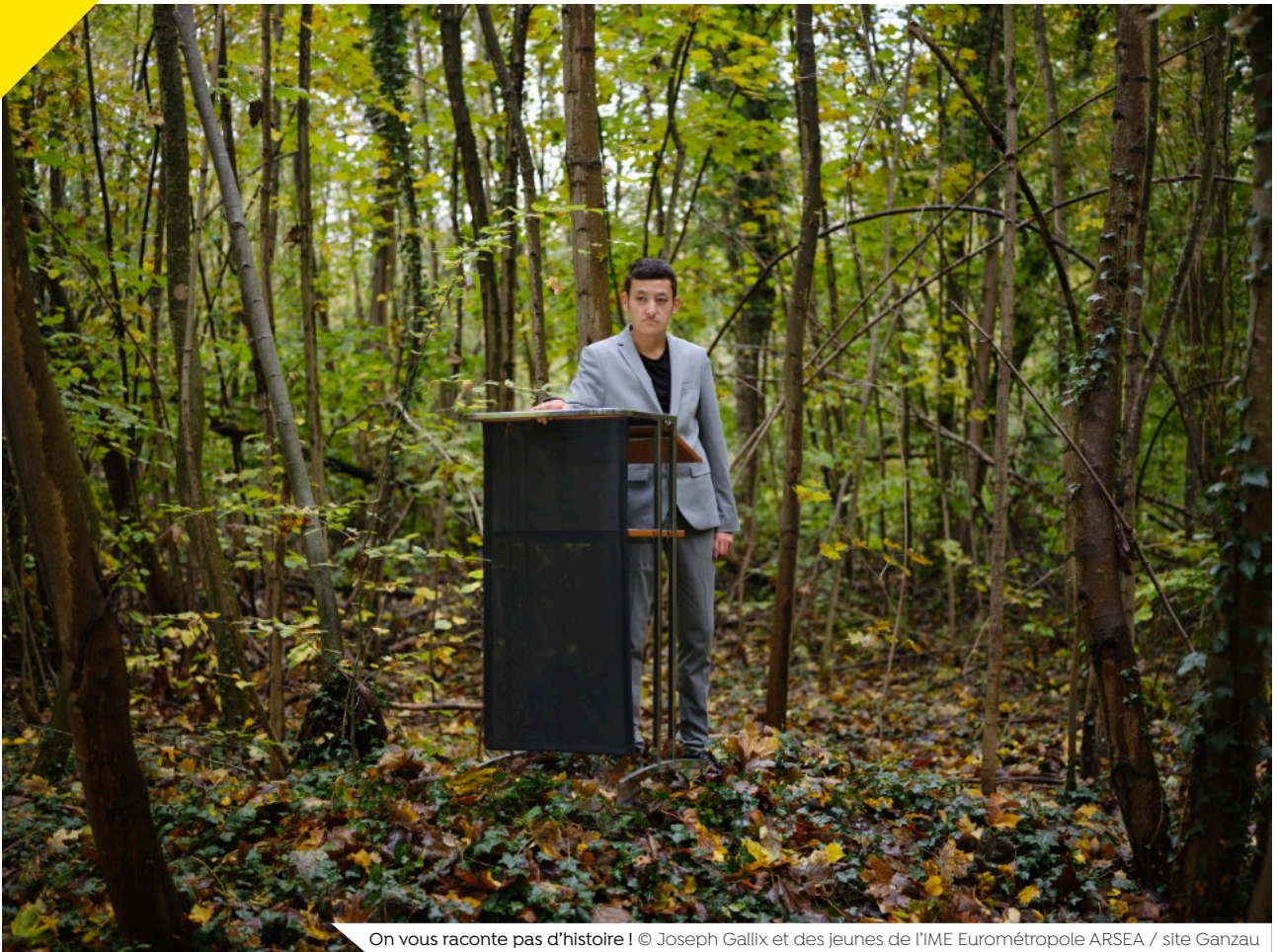
On vous raconte pas d'histoire ! © Joseph Gallix et des jeunes de l'IME Eurométropole ARSEA / site Ganzau