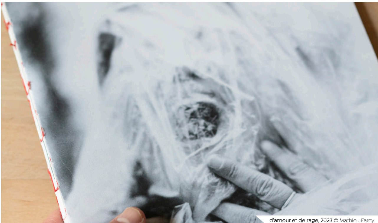
d'amour et de rage, 2023 © Mathieu Farcy

Œuvre créée dans le cadre de la résidence de création 5 étoiles portée par Stimultania