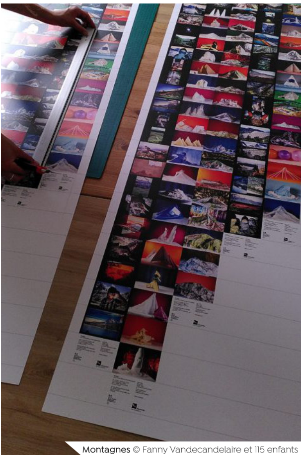
Montagnes © Fanny Vandecandelaire et 115 enfants