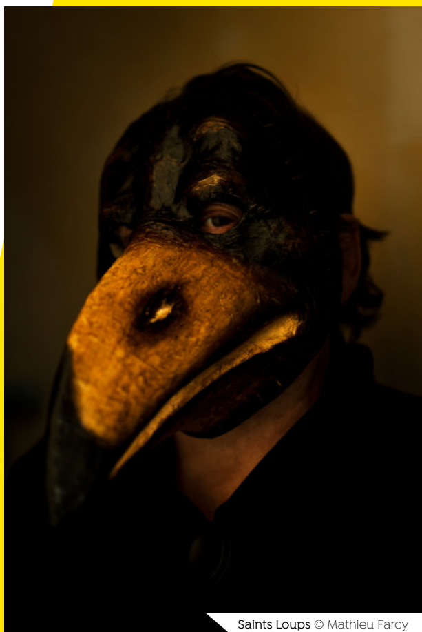
Saints Loups

Œuvre créée dans le cadre de la résidence de création 5 étoiles portée par Stimultania