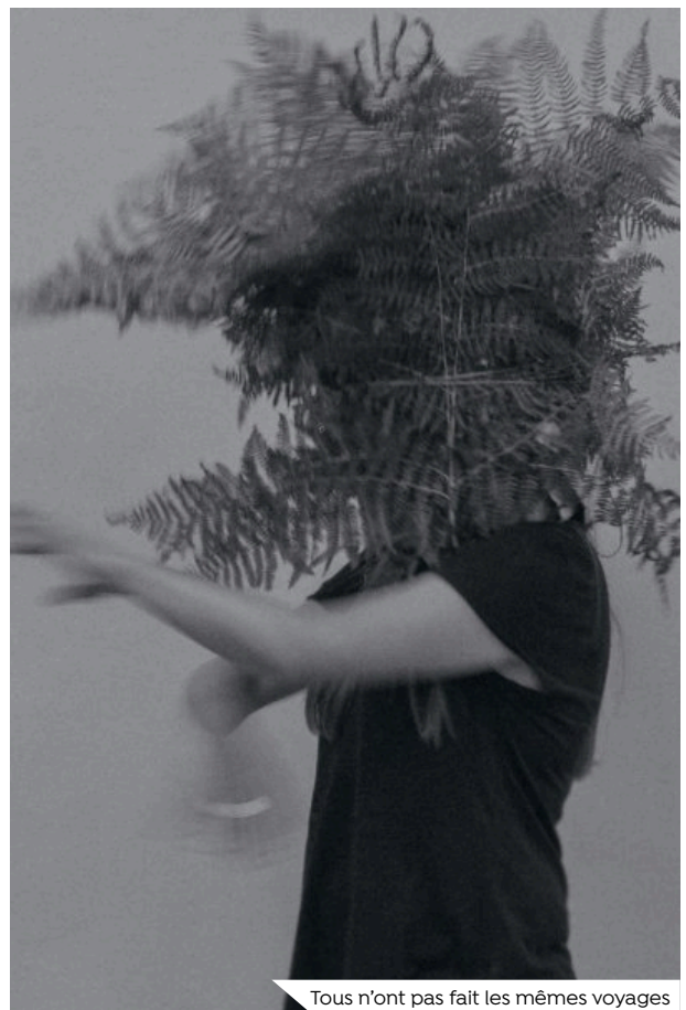
Tous n'ont pas fait les mêmes voyages

© Marine Lanier, La bonne adresse, 12 hommes incarcérés et 7 proches de détenus