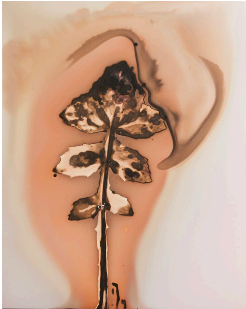
VISUEL 3 Guiliano, Zona ASI Brassicace © Anaïs Tondeur